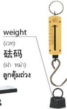
weight (เวท) 砝码 (ผา หม่า) ลูกตุ้มถ่วง spring balance (สปริง แบล' เลินซ) 弹簧秤 (กัน หวง เซ็ง) ตาชั่งสปริง