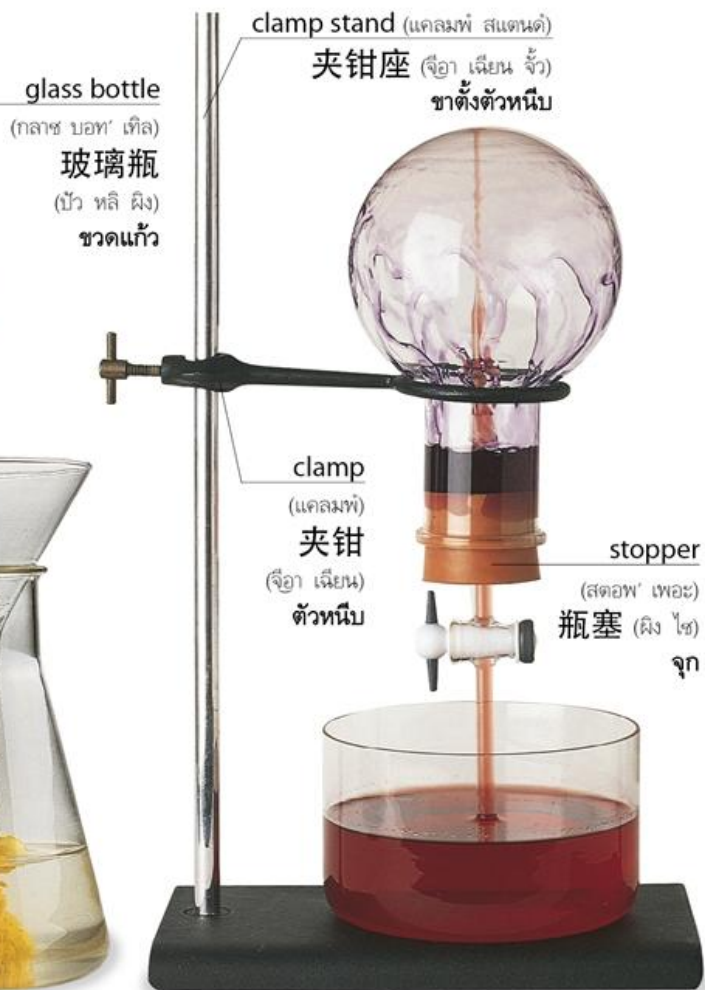
glass bottle (กลาช บอท' เทิล) 玻璃瓶 (ปัว หลี ผิง) ขวดแก้ว