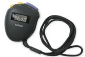
timer (ไท' เมอะ) 计时器 (จื่อ เสื่อ ซื่อ) นาฬิกาจับเวลา