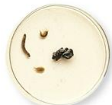
petri dish (เพ' ทรี ดิช) 培养皿 (ผ่าย หยั่ง หมั่น) จานเพาะเชื้อ