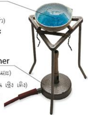
bunsen burner (บัน' เซิน เบอ' เนอะ) 本生灯 (เบิ่น เซ็ง เต็ง) ตะเกียงบุนเซน