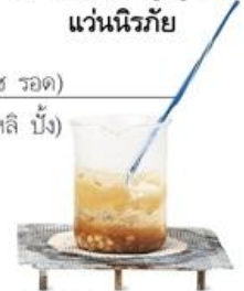
beaker (บี' เคอะ) 烧杯 (เซา เปย) บีกเกอร์