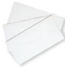
envelope (เอน' วะโลพ) 信封 (ซิ่น เฟิง) ซองจดหมาย