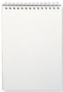
note pad (โนท แพด) 便笺 (เปี่ยน เจียน) กระดาษโน้ต