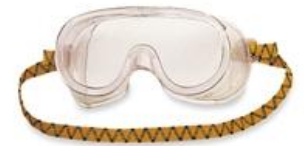
safety goggles (เซฟ' ที กอก' เกิลซั) 护目镜 (ฮู่ มู่ จี้) แว่นนิรภัย