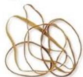
rubber band (รับ' เบอะ แบนด์) 皮筋 (ผี จิน) ยางรัดของ