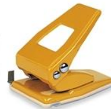
hole punch (โฮล พันซ) 打孔器 (ตา ซ่ง ซี้) เครื่องเจาะกระดาษ