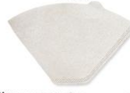
filter paper (ฟิล' เทอะ เพ' เพอะ) 滤纸 (ลี้ จื่อ) กระดาษกรอง