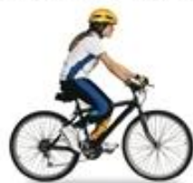
mountain bike (เมาเทิน บิไซเคิล) 山地车 (ชาง เต๋ เซอ) จักรยานเสือภูเขา