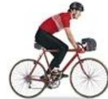
touring bike (ทัวริ่ง บิไซเคิล) 旅行车 (ชาง ลิง เซอ) จักรยานทัวร์ริ่ง