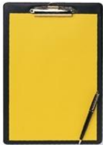
clipboard (คลิพ' บอด) 带纸夹的笔记本 (ได้ จื่อ จื่อ เตอะ บี จี้ ปิ่น) แผ่นรองเขียนมีที่หนีบ