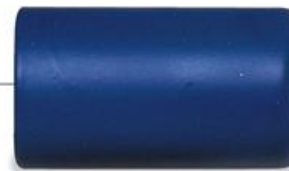
battery (แบท' ทะรี) 电池 (เตี้ยน ฮือ) แบตเตอรี่