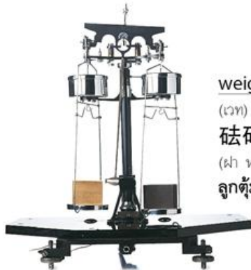
scale (สเกล) 天平 (เทียน ผิง) ตาชั่ง