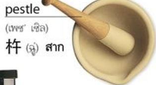
pestle (เพซ' เซิล) 杵 (ชู่) สาก