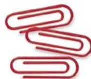
paper clip (เพ' เพอะ คลิพ) 曲别针 (ชวี เปี่ย เซิน) ลวดหนีบกระดาษ