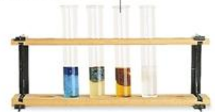
rack (แรค) 试管架 (ซื่อ กวาน จื่อ) วางวางหลอดทดลอง