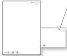
letterhead (เลห์' เทอะเฮด) 信头纸 (ซิ่น โถว จื่อ) กระดาษหัวจดหมาย