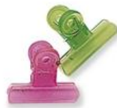
bulldog clip (มุล' ดอก คลิพ) 强力纸夹 (เจียง ลี จื่อ จื่อ) ตัวหนีบ