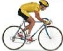
racing bike (เรซ บิไซเคิล) 赛车 (ไ่ เซอ) จักรยานแข่ง