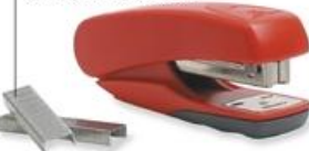
stapler (สเต' เทลอะ) 订书机 (ตั้ง ชู จี) ที่เย็บกระดาษ