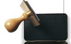
rubber stamp (รับ' เบอะ สแตมพ์) 橡皮图章 (เซียง ผี ญู จัง) ตรายาง