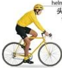
road bike (โรด บิไซเคิล) 公路车 (ชาง ลู เซอ) จักรยานเสือหมอบ