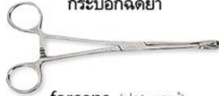
forceps (ฟ้อ' เซพซั) 医用钳 (อี ยง เจียน) คีมคีบ