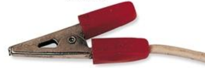
crocodile clip (ครอค' คะไดล์ คลิพ) 鳄鱼夹 (เอ้อ ฮู่ จืออา) คลิปปากจระเข้