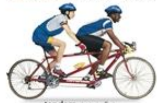
tandem (แตนแตม) 双座自行车 (ชาง จื่อ จื่อ ลิง เซอ) จักรยานสองคน