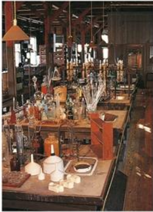
laboratory (ลอบอ' ระหรี) 实验室 (เสื่อ เยียน ซื่อ) ห้องปฏิบัติการ