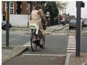
cycle lane (ไซเคิล เลน) 自行车道 (จื่อ ลิง เซอ เต๋) ทางจักรยาน