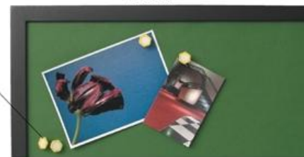
notice board (โน้' พีซ บอด) 公告栏 (กง เก้า หลัน) กระดานประกาศ