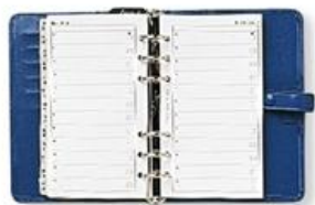
personal organiser (เพอ' ซะนิล ออ' กะโนซอะ) 备忘录 (เปี่ย วัง ลู) สมุดบันทึกส่วนตัว