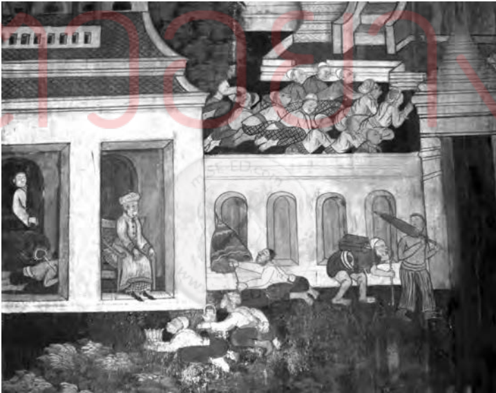
ภาพที่ ๔ ภาพขุนนางแขกในจิตรกรรมฝาผนัง วัดโสมนัสวิหาร กรุงเทพฯ

กับประเทศที่นับถือศาสนาอิสลามอย่างต่อเนื่อง ทำให้มุสลิมในกรุงเทพฯ และปริมณฑลมีบทบาทในสังคมและมีส่วนร่วมในด้านต่างๆ ที่สำคัญ ทั้งทางด้านการเมือง การปกครอง การทหาร และการพาณิชย์ โดยที่ยังคงอัตลักษณ์ของตนไว้ได้ การปรับตัวของมุสลิมในกรุงเทพฯ เป็นไปในลักษณะของการผสมผสานวัฒนธรรมภายในขอบเขตของศาสนา มาสู่สังคมมุสลิมที่มีความเป็นอันหนึ่งอันเดียวกันภายใต้แนวคิด อิควาฮ์ (Iqwah) ซึ่งหมายถึงการเป็นพี่น้องกันหรือภราดรภาพของมุสลิม (ภาพที่ ๔-๕)