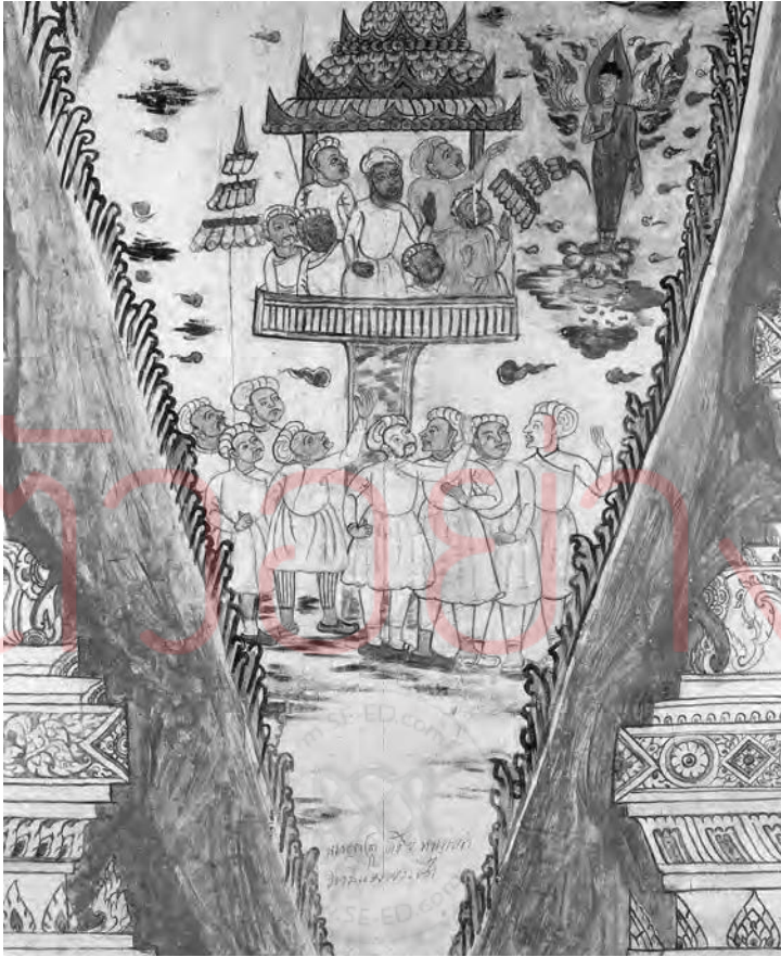
ภาพที่ ๒ ภาพของ “แขก” ที่ปรากฏในจิตรกรรมฝาผนัง วัดเกาะแก้วสุทธาราม จังหวัดเพชรบุรี