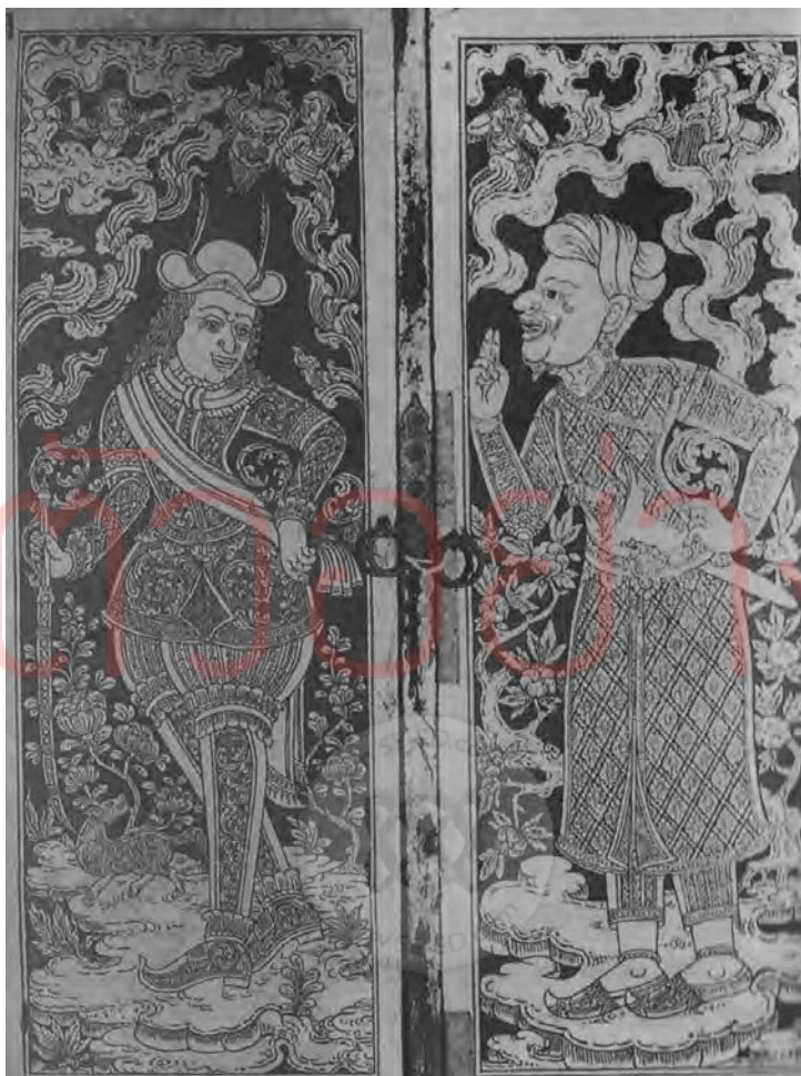
ภาพที่ ๓ ภาพกษัตริย์ฝรั่งเศสและเปอร์เซียในภาพลายรดน้ำบนฝาตู้พระไตรปิฎกสมัยอยุธยาตอนปลาย